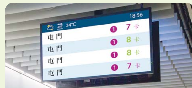
2016年1月起逐步採用新的乘客資訊顯示屏，會以兩種顏色顯示車卡數目

○ 新增月台候車位置 ——當7卡及8卡列車同時運行，月台會增設第8卡列車的候車位置，請依照顏色標誌或職員指示在適當的位置排隊候車