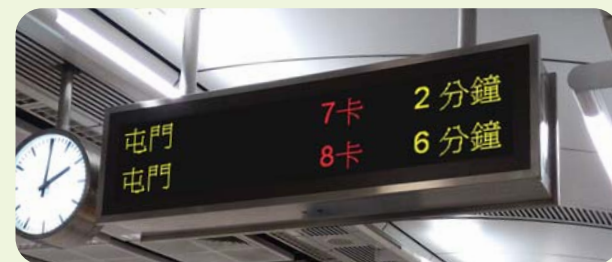
現有的乘客資訊顯示屏

○ 乘客資訊顯示屏 ——月台上的資訊顯示屏會顯示下一班到站列車的車卡數目，讓您更容易識別7卡及8卡列車