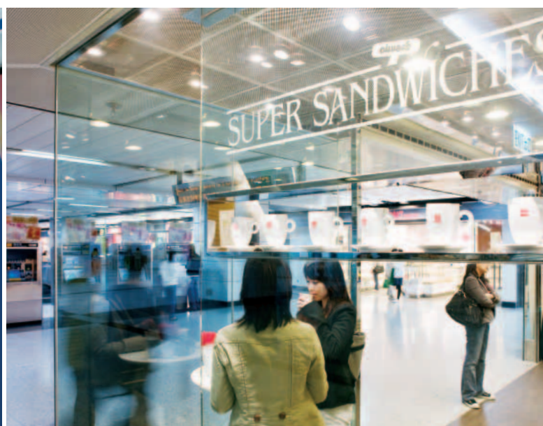
港鐵商店繼續增加令人振奮的新品牌