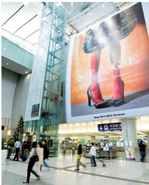
在九龍站內掛起的巨型廣告

年內，地鐵系統零售網絡引入31個新商品類別及品牌以提升顧客滿意度。兩鐵合併後，車站商店於年底為1,230間，包括9間免稅店分佈在羅湖站、落馬洲站及紅磡站。