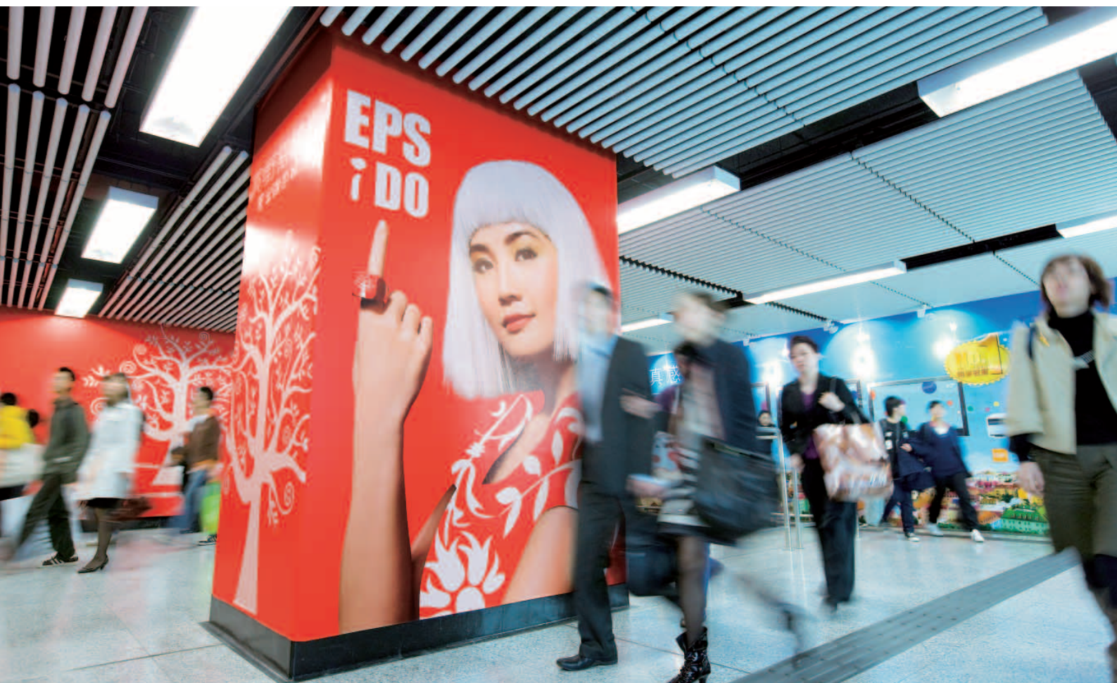
港鐵車站內無可比擬的媒體平台，提供矚目的廣告形式

車站內商務及鐵路相關業務繼續受惠於2007年的強勁經濟及乘客量增長。兩鐵合併後經營規模擴大，不僅加速收入增長亦為公司帶來免稅店及貨運的新商機。