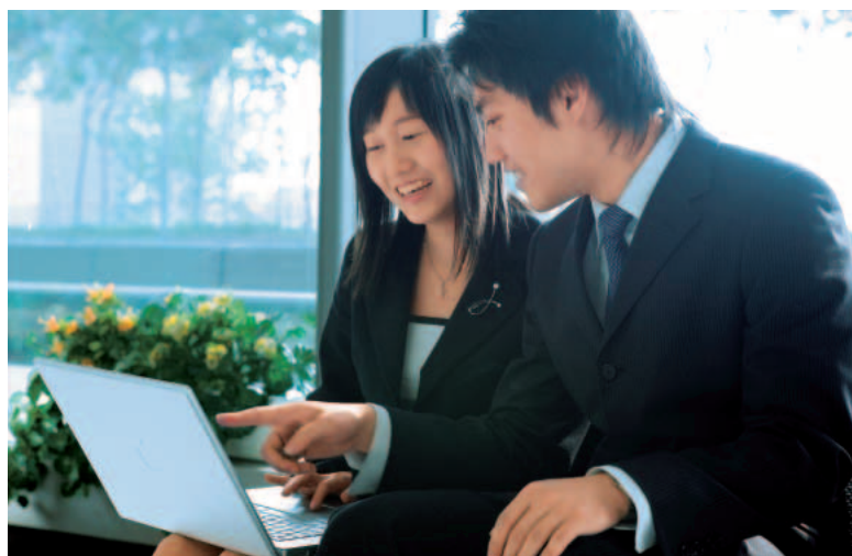
我們現已在16個本地鐵路服務車站和4個機場快綫車站提供無綫上網服務

運輸局進行的工作，亦進展良好。公司成功為香港國際機場的旅客捷運系統擴展項目建立供電及訊號系統，該項目已於2007年2月啟用。年內，我們繼續進行項目二期的設計工程，並將於項目二期工地開通時(預期為2008年5月)展開裝配工程。