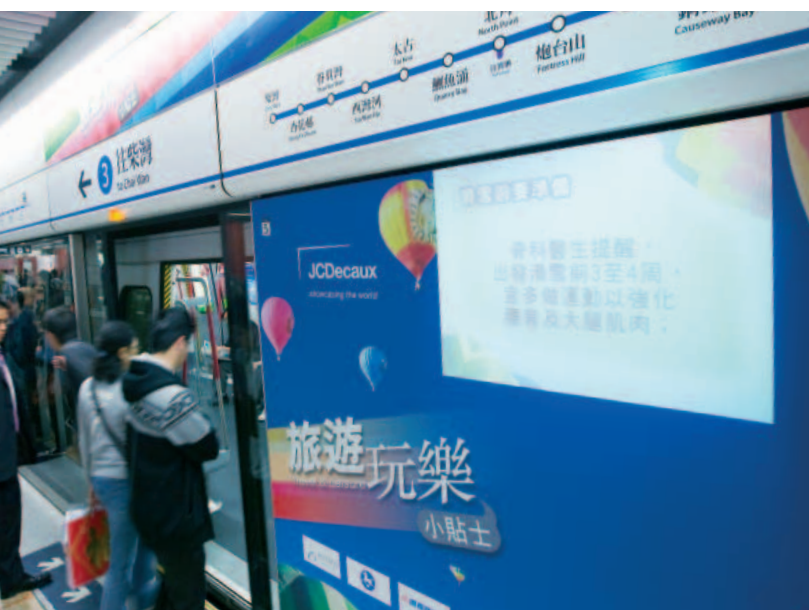
中環站的創新展示模式包括投影廣告