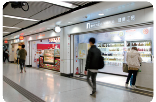
港鐵車站商店為乘客提供多姿多采的購物體驗

為配合乘客對流動數據服務的殷切需求，我們協助兩個電訊服務供應商為15個位於主要地區的車站增加3G流動數據傳輸容量，並協助另外兩個電訊服務供應商完成提升他們在港鐵網絡沿綫流動電話設備的接收能力。