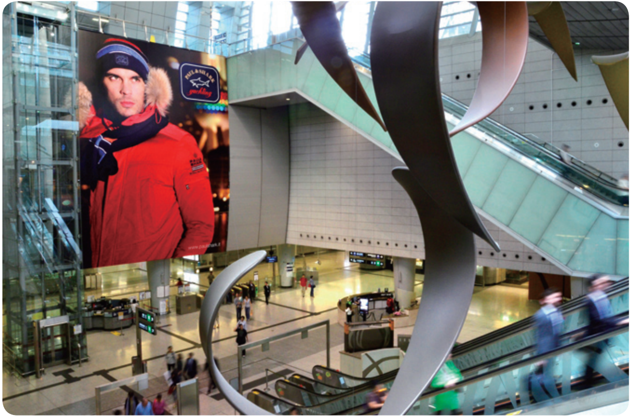
這塊巨型廣告板令九龍站的購物環境更添動感