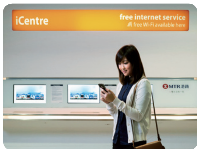
我們的iCentres為乘客提供免費的互聯網和Wi-Fi服務