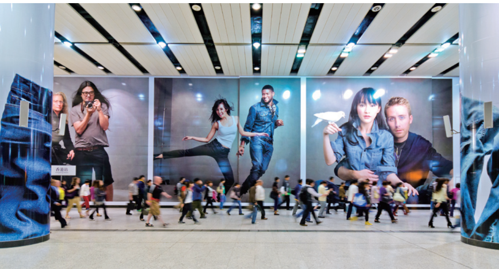
香港站開創廣告宣傳的新境界

為加強港鐵車站商店在租戶和乘客心目中「型買行」的形象，公司推出多項品牌及商戶推廣活動，其中包括主題式廣告宣傳活動。另外，公司還製作了一系列海報以宣傳推廣新開業的商店，而「MTR Shops人氣十大型品潮選」，讓購物人士加深認識MTR Shops豐富及多元化的商品類別。年內，公司還推出其他有助刺激或加強乘客購物意欲的推廣活動，包括「落馬洲結伴乘車優惠」推廣活動、使用積分卡的港鐵友禮會「站站獎」積分計劃，以及深受乘客歡迎的「MTR Shops開箱！淘獎！」抽獎活動。