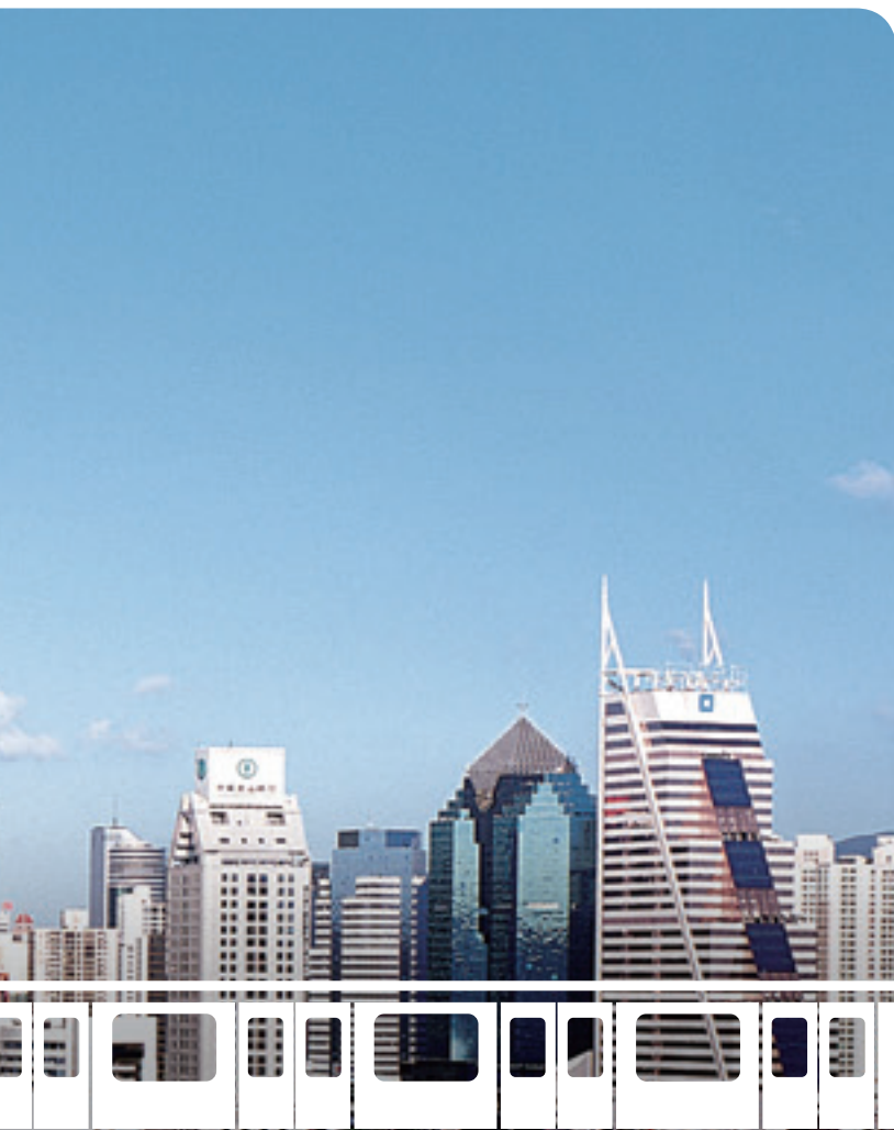
公司在中國內地的業務取得穩定增長

公司的中國內地及國際附屬公司於2012年的收入合共為127.86億港元，當中來自香港以外鐵路附屬公司的收入，即Metro Trains Melbourne Pty. Ltd. (「MTM」)、MTR Stockholm AB (「MTRS」)及港鐵軌道交通(深圳)有限公司為126.50億港元，較2011年增加3.0%。收入增加主要由於計入港鐵軌道交通(深圳)有限公司的首年全年度業績，以及MTM的收入增加。而公司在中國內地的物業租賃和物業管理附屬公司則合共錄得1.36億港元的收入。香港以外鐵路附屬公司的經營成本為120.66億港元，經營利潤增加30.1%至5.84億港元，而經營毛利率則為4.6%。儘管MTM的財務表現能達到我們當初競投該項目時的預期，但MTRS和港鐵軌道交通(深圳)有限公司到目前為止的表現，仍未能夠達到項目的相關目標。