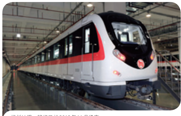
杭州地鐵一號綫已於2012年11月通車

在北京，北京京港地鐵有限公司於2012年10月簽訂北京地鐵十四號綫的中期營運和維修協議，並於2012年11月與北京市政府草簽該地鐵綫的特許經營協議。根據這項斥資約500億元人民幣、為期30年的「公私合營」項目協議的要求，北京京港地鐵有限公司將負責提供價值約為150億元人民幣的機電設備系統及列車，而北京市政府則負責項目的投資餘額。北京京港地鐵有限公司將會以資本金及借貸組合出資興建該項目，而港鐵公司將會對北京京港地鐵有限公司增資約22億元人民幣。該地鐵綫全長47.3公里，共有37個車站，連接南豐台區的張郭莊站與東朝陽區的善各莊站，沿途有十個轉綫車站。建造工程已於2010年展開，計劃分期通