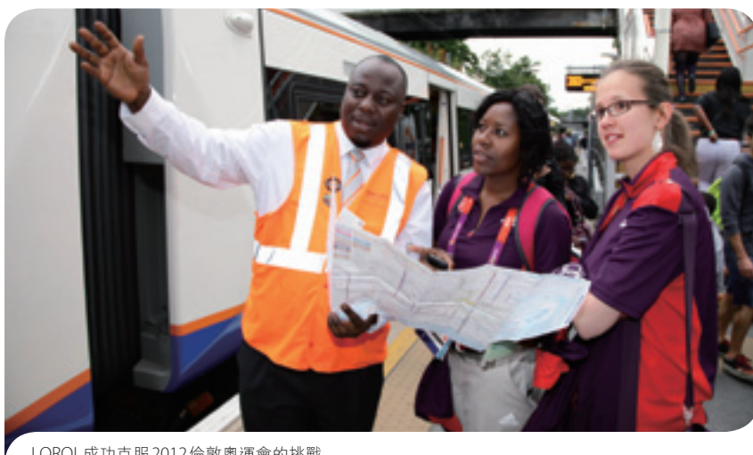
LOROL成功克服2012倫敦奧運會的挑戰

「公司在香港以外的附屬及聯營鐵路公司於2012年錄得總乘客量約為11.71億人次...」