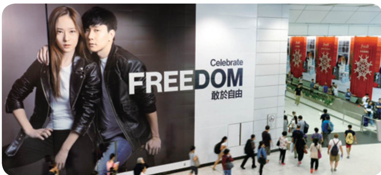
香港站轉綫區域提供廣泛的廣告宣傳機會

於2015年，公司的電訊業務收入增加14.4%至5.48億港元，由一次性的項目行政費、港島綫西延的新車站帶來的額外收入，及電訊營運商進行流動數據容量升級工程所致。新建南港島綫(東段)及觀塘綫延綫車站的流動電話及Wi-Fi服務安裝工程正繼續進行。港鐵已與全部流動網絡營運商達成協議，將建立一個新的流動網絡，在八個繁忙的車站提供更大的流動數據容量及更多的4G服務。該項工程現正進行招標。