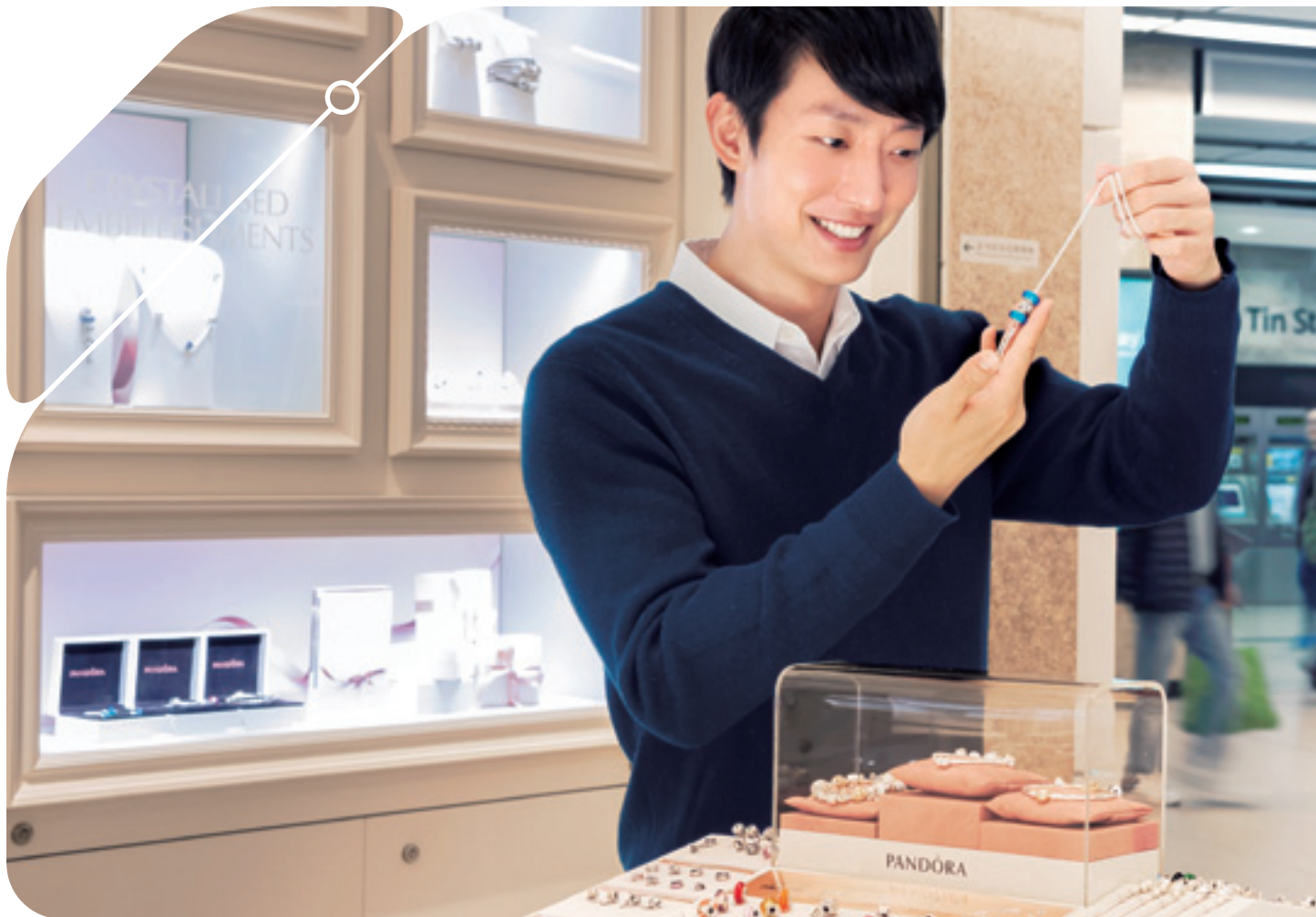
港鐵繼續吸引新品牌進駐車站商店，令乘客更感滿意