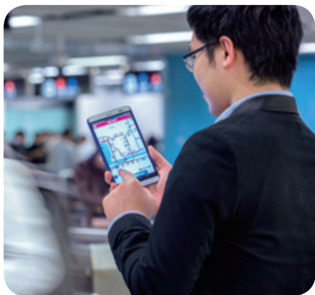
電訊營運商繼續提升港鐵網絡的流動數據容量

田至中環綫項目施工，灣仔站及金鐘站正進行翻新工程，導致部分商店被關閉，因而抵銷了部分年內開設的新商店數目。於2015年，進駐車站商店的新品牌總數達25個，港鐵網絡各處亦有海報展示進駐車站的新品牌。