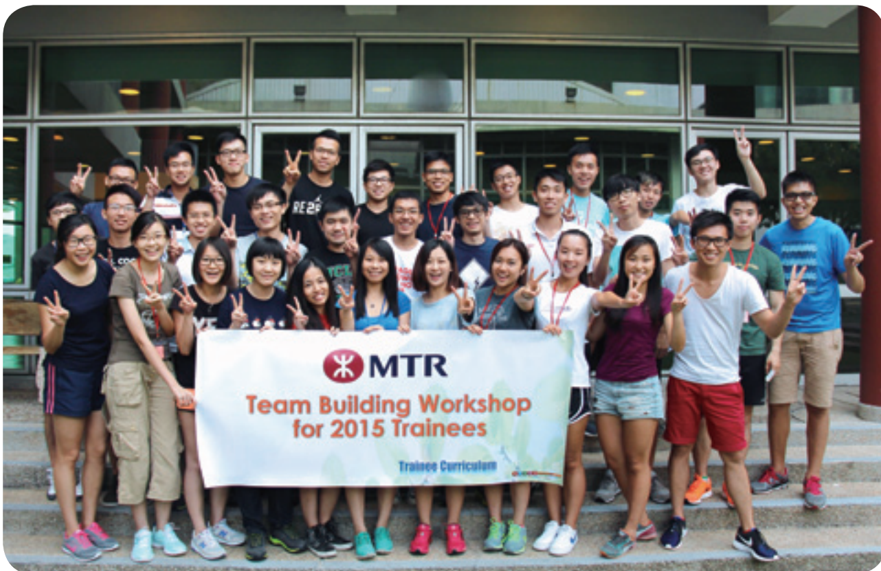
我們透過各項見習人員發展計劃，培育年青人才

Talent Development)的「卓越培訓實踐獎」，而港鐵亦是五間獲香港管理專業協會頒發的「25週年 — 致力人才發展機構榮譽大獎」的機構之一，見證公司多年來在促進員工發展方面的傑出成就。