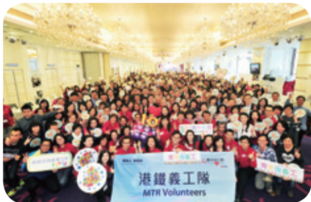
透過「鐵路人 鐵路心」計劃，鼓勵員工積極服務社會

公司透過跨國內部溝通平台「MTRconnects」，分享公司的最新發展和員工的故事，藉此加強全球各地員工之間的溝通。截至年底，平台錄得超過563,000次瀏覽，其中單一訪客超過13,300個。