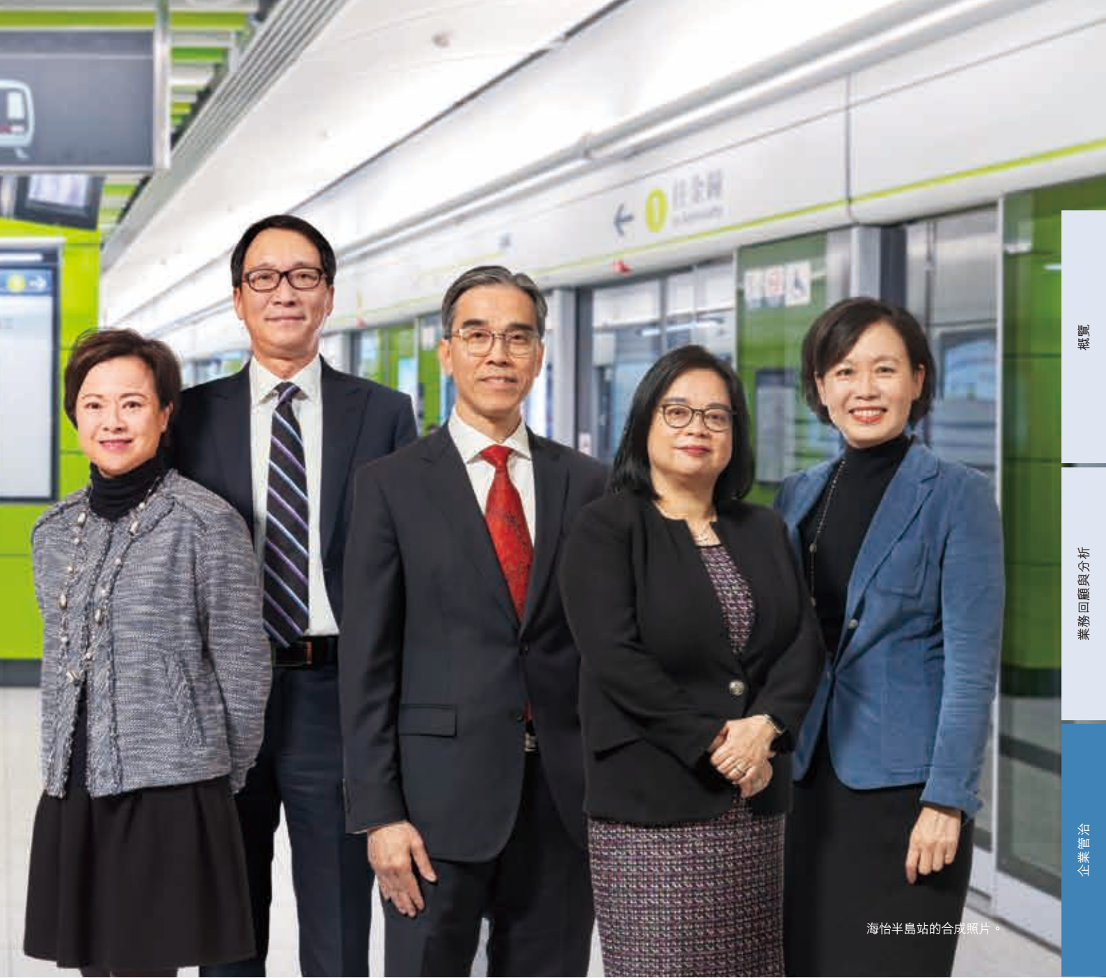
海怡半島站的合成照片。

出任執行總監會成員。他負責監督本公司於香港的客運業務，以及在中國內地的鐵路和物業業務。此外，金博士亦負責監督本公司在全球的鐵路營運標準及促進各地最佳作業模式的交流。