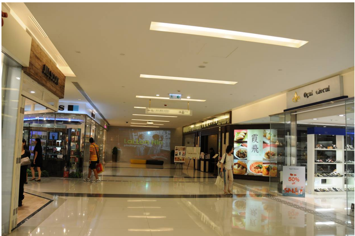
擬建加拿分道行人隧道 - 於 K11 地庫 2 層的接駁口