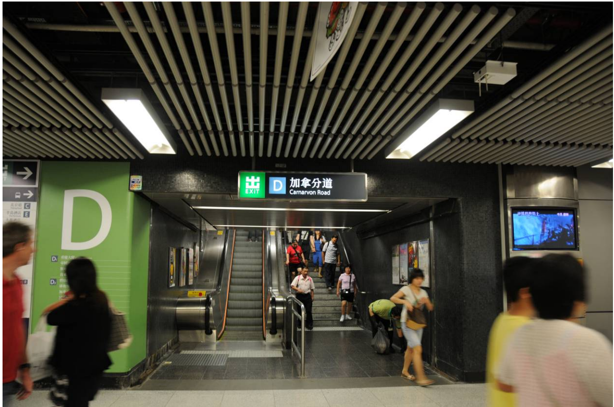
擬建加拿分道行人隧道 - 於尖沙咀車站大堂的接駁口