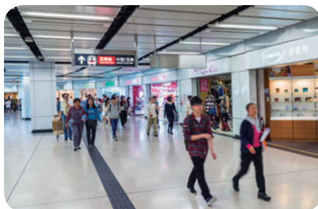
港鐵商鋪提供各式貨品及服務，以滿足乘客的需要

為進一步強化及提升港鐵車站商店的品牌定位，公司於2014年3月至5月間再次推出「隨行隨買」品牌推廣活動，