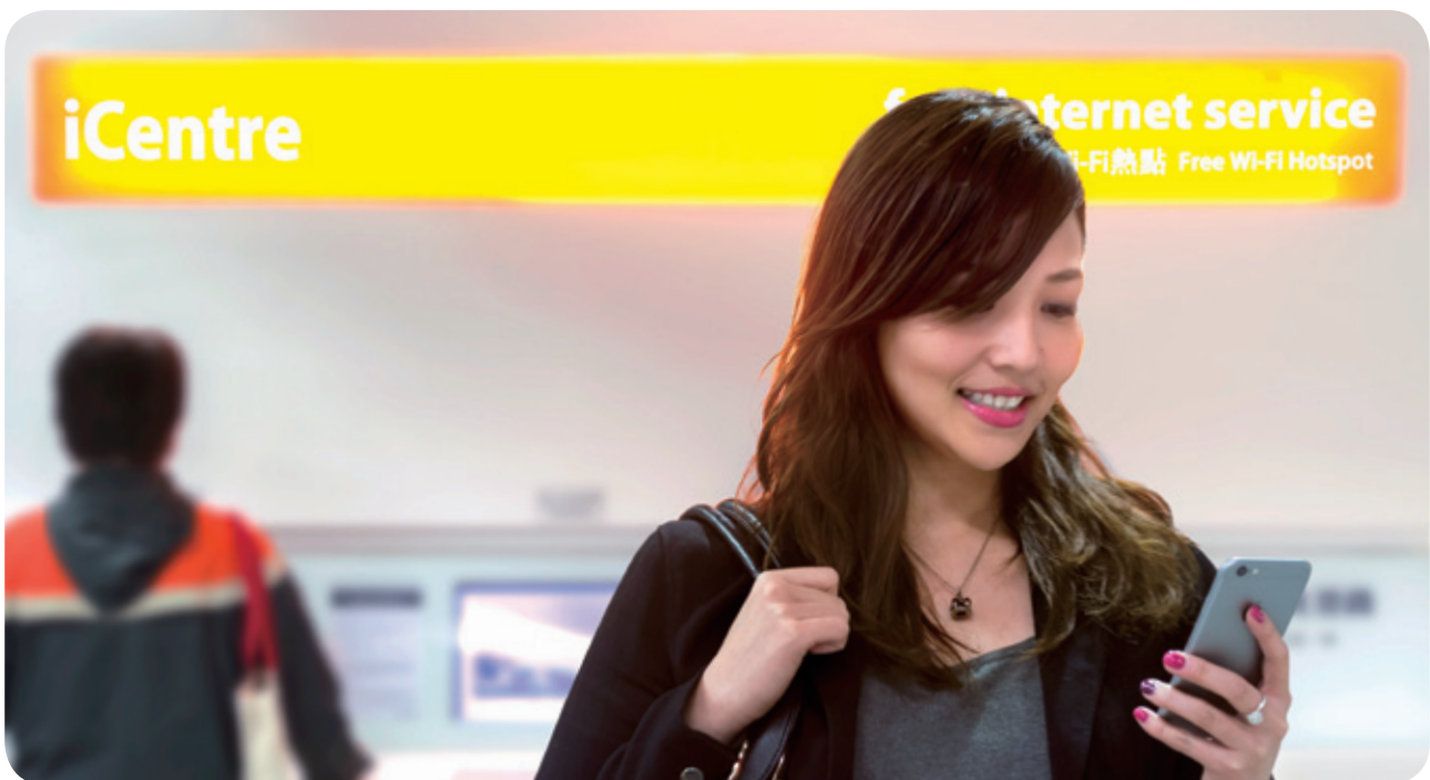
iCentres及Wi-Fi熱點為乘客提供無線上網服務

於2014年12月31日，港鐵的車站商店數目達1,350間，而零售設施的總面積為55,696平方米。年內，堅尼地城站及香港大學站於12月開設14間新商店，另外九個車站新增35間商店，而進駐車站商店的新品牌總數達28個。然而，紅磡站為配合沙田至中環綫建造工程而拆遷的商店，抵銷了新店面積的增幅，令零售設施的總面積減少1%。