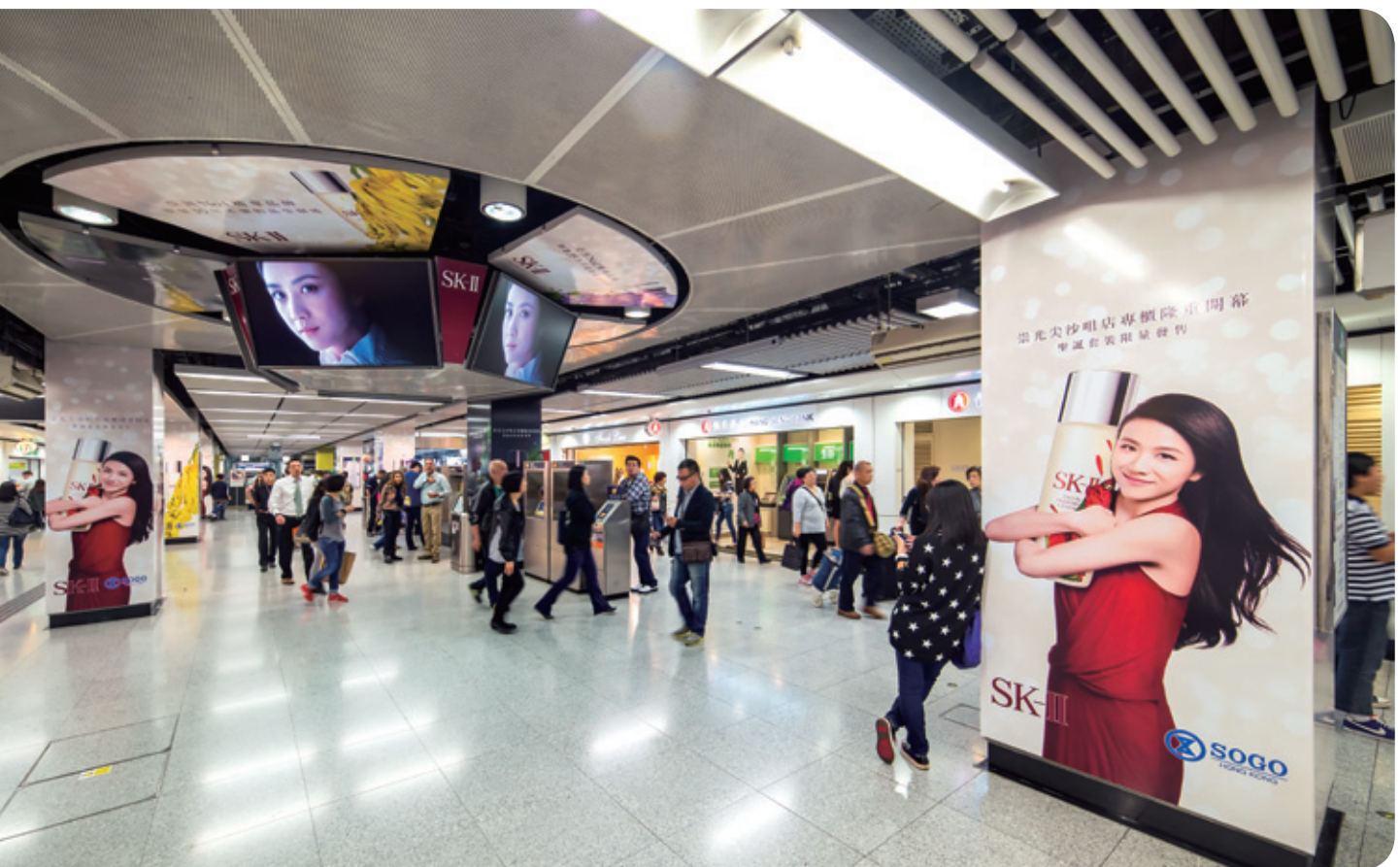
主題式廣告套餐，讓廣告商的推廣活動發揮強大成效