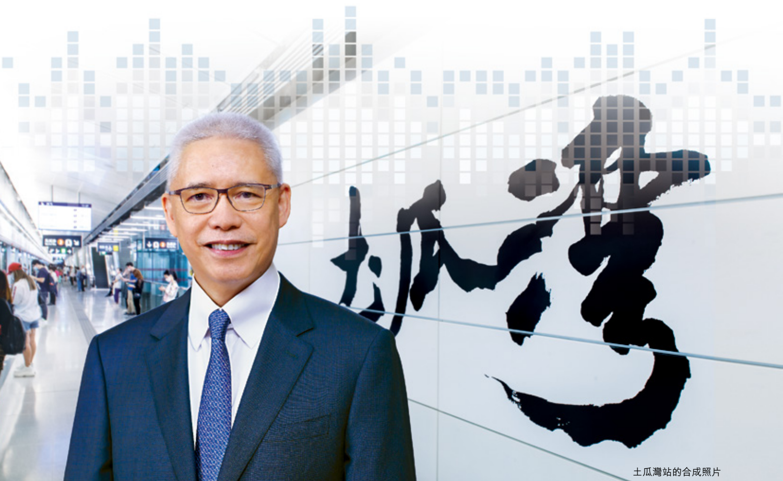
土瓜灣站的合成照片