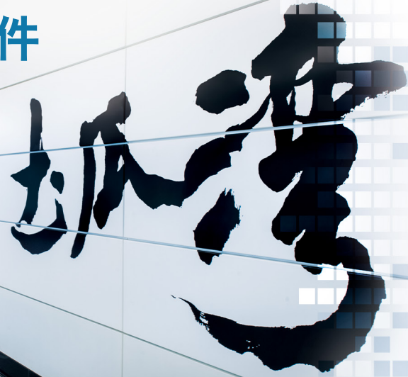
士瓜灣站的合成照片