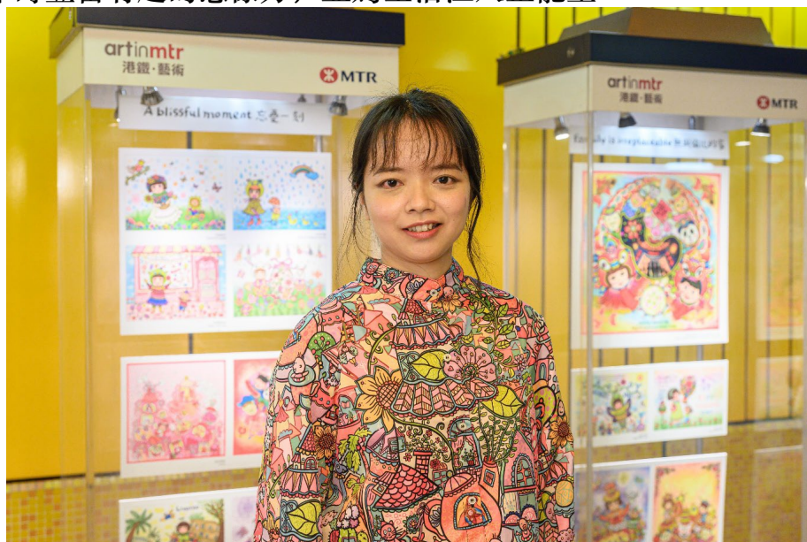
(本地插畫師哇啦豆)